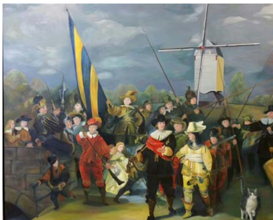
De Aurora op de Dagwacht

Ieder jaar organiseert de Stichting Kunst & Cultuur Leudal een kunstfietsroute door een deel van de gemeente. Alle deelnemende kunstenaars wonen en werken in de directe omgeving en stellen hun creaties tentoon. Onlangs was dat in de kern Baexem, Grathem en Kelpen-Oler.